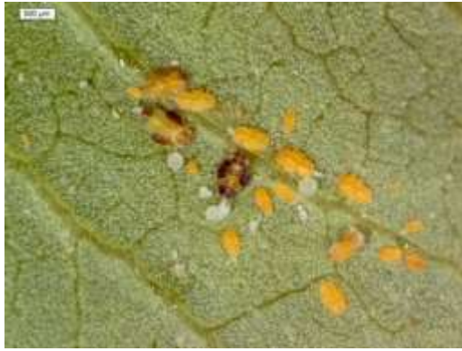
شکل ۳- سنین مختلف پورگی پسیل معمولی پسته (عکس از بصیرت).