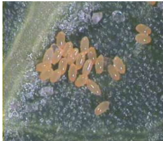
شکل ۲- تخم‌های پسیل معمولی پسته.