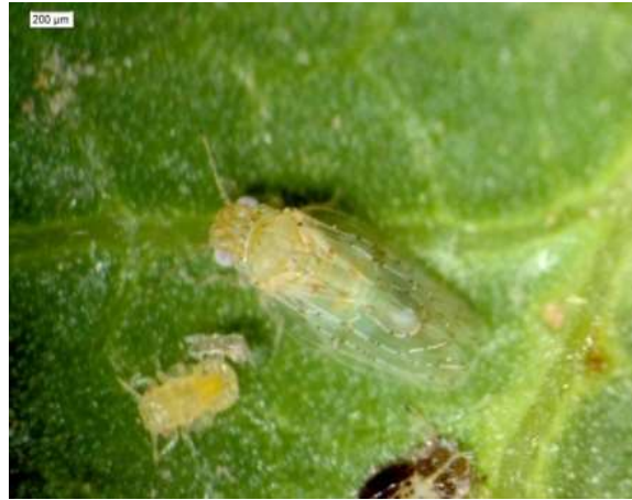
شکل ۱- حشره کامل (فرم تابستانه) و پوره پسیل معمولی پسته.